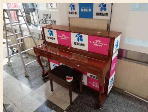
河合楽器さん、ご提供有難うございました。

メッセージの中には、「仙台から弾きに来ました！」 「ブラジルから来ました！」「本当に楽しかった！」 圧倒的に多かったのは「名古屋にストリートピアノを 置いてほしい！」というご意見でした。また、極東証 券へのメッセージも多数いただき、本当に有難うござ いました。