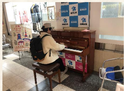
↑ピアノマンさん (11/2の新聞でピアノマン さんが紹介され一躍、会場の人気者になっ ていました。) 4日間皆勤賞、お疲れさまでした。 本当に有難うございました。